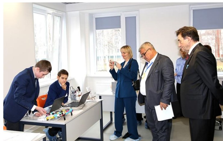
Инженерная выставка в IT клубе Лангепаса.

Кроме того, на базе центра «Креатив» проходит десятая инженерная-техническая выставка «Молодой изобретатель». Юные лангепасцы представили на суд жюри действующие модели, разработанные вместе с наставниками, – программируемых роботов, полезные в быту концепты гаджетов и настольных игр.